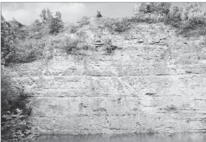
Oberer Muschelkalk in einem aufgelassen Steinbruch.