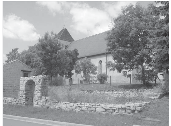
Esperstedter Kirche aus Stadt- und Land-Bote Weida-Land Januar 2015

Weitere Informationen unter www.evkirchspielquerfurt.de