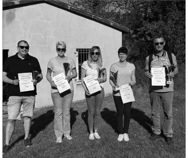
Die Gewinnerinnen und Gewinner des Bürgerpokals am 1. Mai 2026.

Der Schützenverein Nemsdorf-Göhrendorf bedankt sich herzlich bei allen Teilnehmerinnen und Teilnehmern, die beim Wettkampf um den Bürgerpokal am 1. Mai 2026 ihr Können unter Beweis gestellt haben.