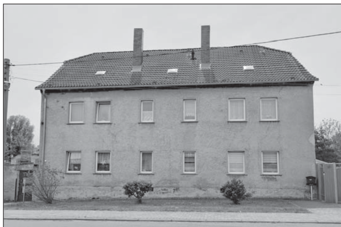
Pfarrgasse 10, 06268 Obhausen

Verkäufer: Gemeinde Obhausen über Verbandsgemeinde Weida-Land 06268 Nemsdorf-Göhrendorf Objekt: Wohnhaus inkl. 2 Nebengebäuden Objektbeschreibung: freistehendes 2 geschossiges Wohnhaus, teilw. ausgebautes Dachgeschoss, Teilunterkellerung Standort: Pfarrgasse 10 06268 Obhausen Landkreis: Saalekreis Grundstücksgröße: ca. 2.896 m 2 Wohnbaufläche: 813 m 2 Baujahr: ca. 1930 derzeitige Nutzung: 4 vermietete Wohneinheiten Energieausweis: vorhanden