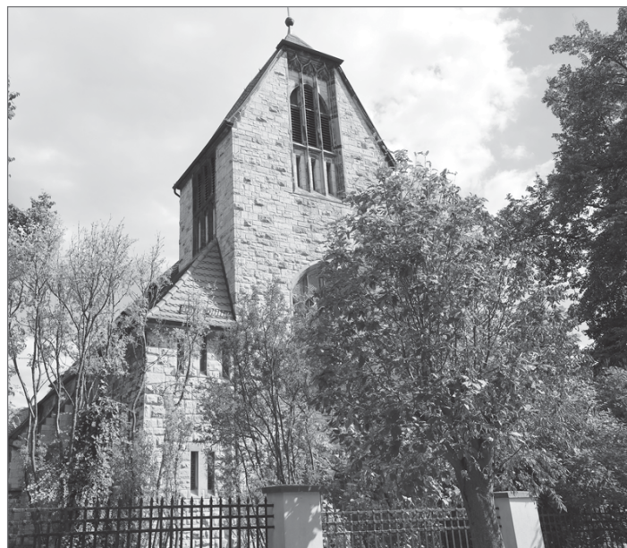
Querfurt – katholische Kirche St. Salvator

Informationen unter www.bruno-von-querfurt.de