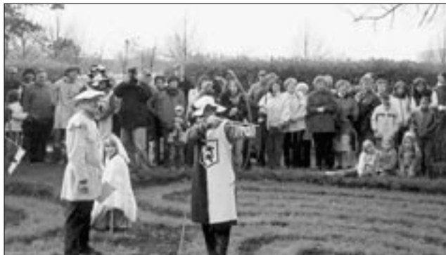
Ritter Hannes (der Sieger) kämpft um die Befreiung der Jungfrau. (2006)

Auf der Trojaburg wird dann die Jungfrau von einem tapferen Ritter aus den Klauen des Drachens befreit.