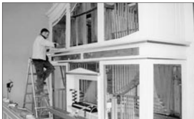
Orgelbauer Thorsten Zimmermann aus Halle wird seine Arbeit an der Baumgartenorgel bis zum 5. Mai beendet haben. Dann soll die Orgel feierlich eingeweiht werden.