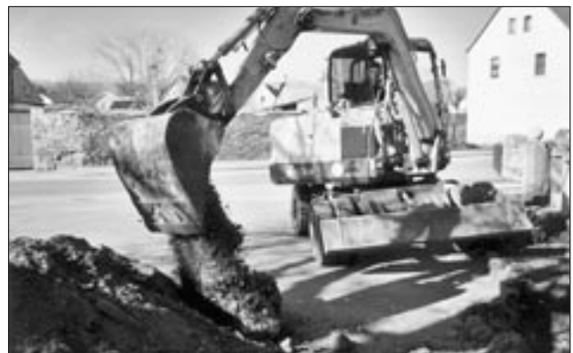
Herr Anton hebt das Fundament aus